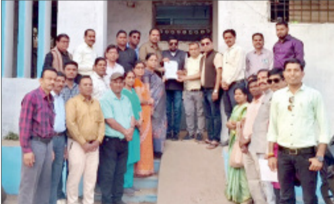
30000 सहायक शिक्षक पदोन्नति एवं क्रमोन्नति से वंचित हैं पदोन्नति हेतु दिए गए वन टाइम रिलेक्सेशन की तरह क्रमोन्नति के लिए 10 वर्ष की सेवा को एक बार वन टाइम रिलेक्सेशन के लिए शिथिल करते हुए 5 वर्ष में क्रमोन्नति का लाभ देने का प्रावधान किया जाए। छत्तीसगढ़ राजपत्र शिक्षक पंचायत संवर्ग भर्ती तथा सेवा की शर्तों के नियम 17 अगस्त 2022 के तहत शिक्षक पात्रता

के बदले दिया जाने वाला स्थायित्व पारिश्रमिक डिफरेंड कंपेंसेशन है, अर्थात् सर्विलियन से पूर्व याचिकाकर्ताओं द्वारा दी गई दीर्घकालीन सेवाओं को अप्रासंगिक मानकर नजर अंदाज नहीं किया जा सकता, सर्विलियन पूर्व सेवा को पेंशन योग्य सेवा मान्य करने हेतु आदेश जारी किया जाए। अपने ज्ञापन में पेंशन निर्धारण के लिए 33 वर्ष अर्हकारी सेवा के स्थान पर केंद्र सरकार, उत्तर प्रदेश सरकार, उत्तराखंड सरकार की तरह छत्तीसगढ़ राज्य में भी 20 वर्ष अर्हकारी सेवा होने पर 50% पेंशन निर्धारण का प्रावधान किया जाए। न्यूनतम 10 वर्ष की सेवा पर पेंशन निर्धारण का प्रावधान है इससे एलबी संवर्ग के अनेकों शिक्षक बिना पेंशन के सेवानिवृत्त हो रहे हैं अतः न्यूनतम 5 वर्ष की सेवा अवधि पर पेंशन निर्धारण का प्रावधान किया जाए।